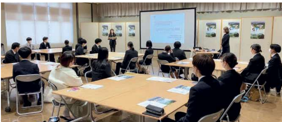
インバウンドおもてなし研修(秋保地区宿泊施設従業員)