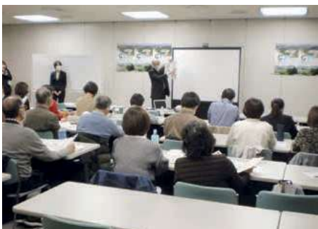
語学ボランティア育成研修