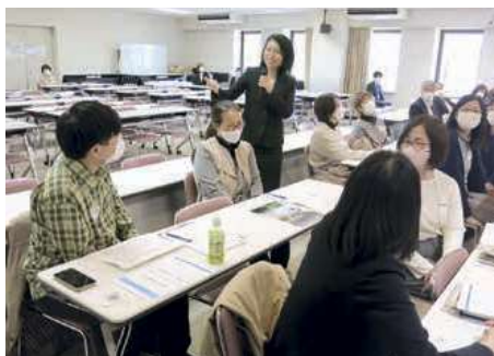
語学ボランティア活動内容説明会でのロールプレイング(話し方・マナー)