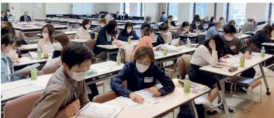
語学ボランティア活動内容説明会でのロールプレイング(英語)