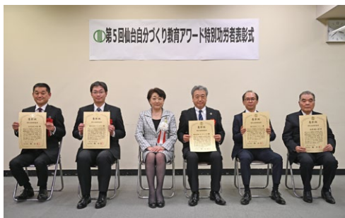
職場体験活動の部