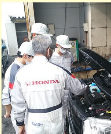
【宮城ホンダ販売株式会社】