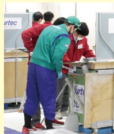
【株式会社ユアテック】