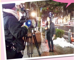
【株式会社 河北新報社】