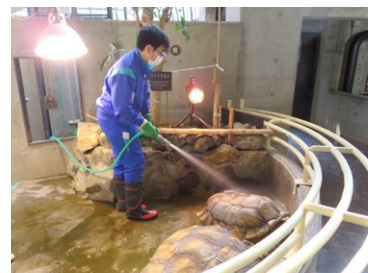
八木山動物公園フジサキの杜(郡山中)