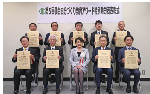
スチューデントシティ協賛企業の部