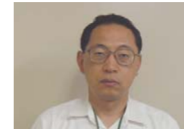
危機管理室 減災推進課