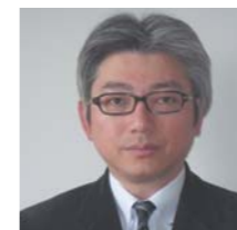
東北大学災害科学国際研究所 情報管理・社会連携部門 災害復興実践学分野 教授