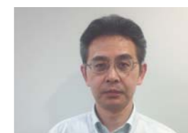
教育局 教育指導課