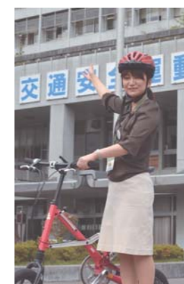
市民局 自転車交通安全課