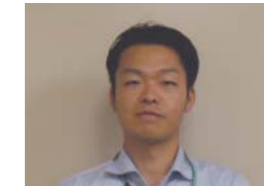
危機管理室 減災推進課