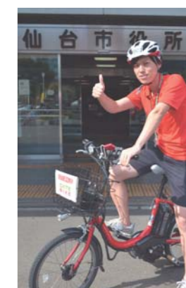
市民局 自転車交通安全課