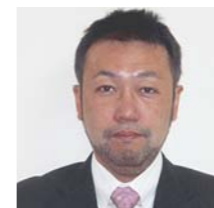
東北工業大学工学部 都市マネジメント学科 准教授