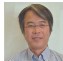
一般社団法人こはく 代表理事