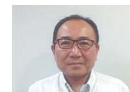
教育局 教育指導課