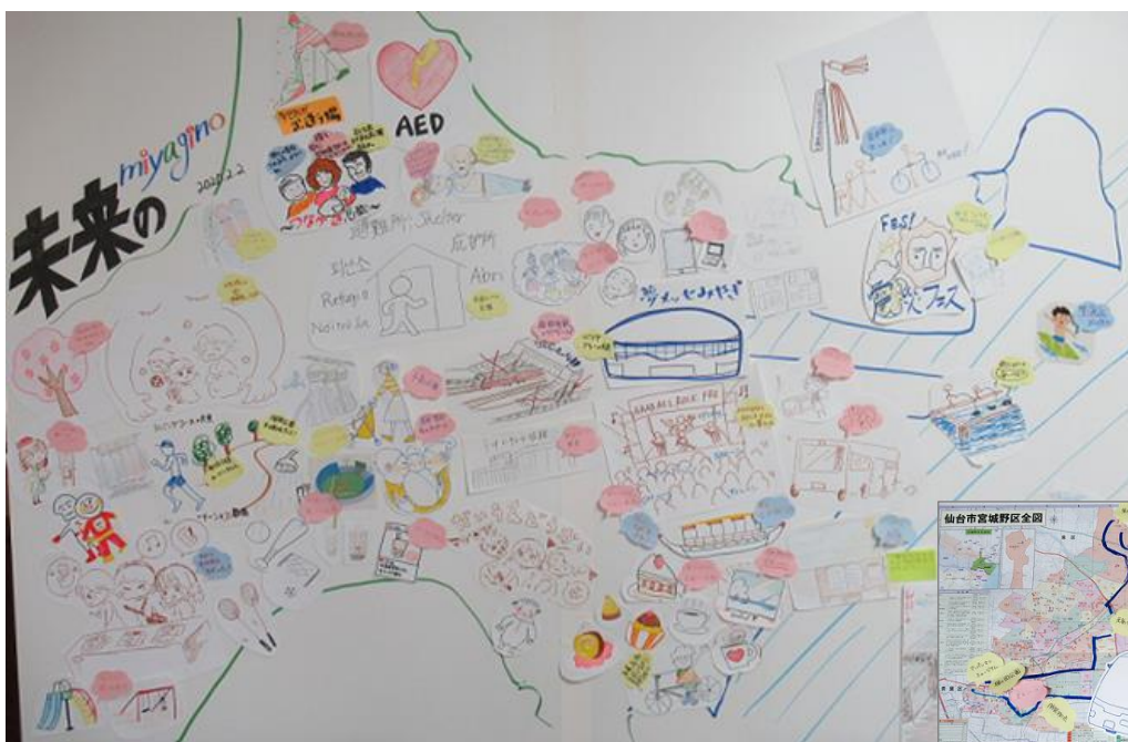
バスツアーマップ