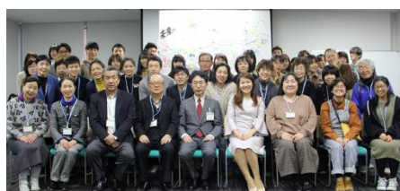
完成した絵をバックに記念撮影！