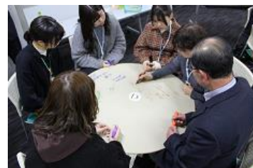
アイデアをどんどん書いて…

「震災の伝承・魅力の発信」「支え合い・安心」「元気・活力」をテーマに、それぞれの事例紹介を踏まえ、こうなればいいなど思えるまちの姿について意見を交わしながら、「えんたくん」（円形段ボール）に書き込み