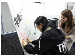
夢を絵にして貼り付けていきます