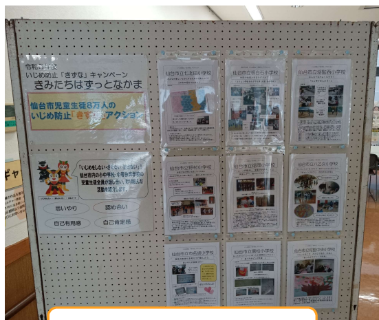
泉区中央市民センター