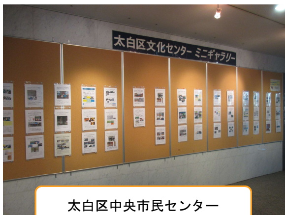
太白区中央市民センター