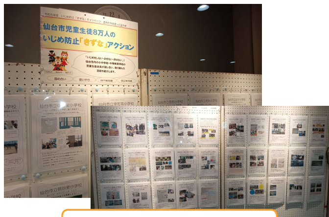
生涯学習支援センター