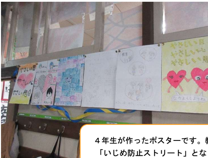
4年生が作ったポスターです。教室前の廊下に掲示して、 「いじめ防止ストリート」となっています。