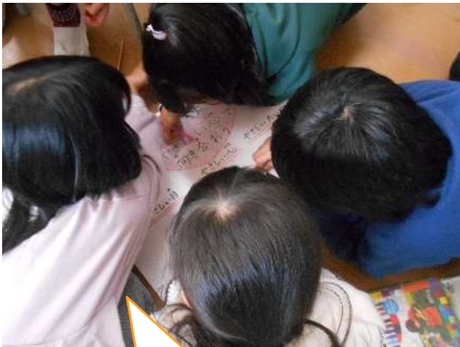
3年生の「いじめ防止ポスター」 作りです！

いじめを防ぐための活動について、まずはクラスで話し合い、それぞれ考えたものを代表委員会でも話し合いました。その結果、今年度取り組む『きずな』アクションについて、中学年では「いじめ防止ポスター」の作成を、高学年は「いじめ防止動画」の作成をして、いじめ防止を呼び掛けていくことにしました。