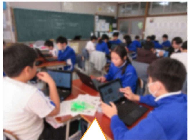
6年生の「いじめ防止動画」 作りです！