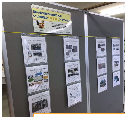
青葉区中央市民センター