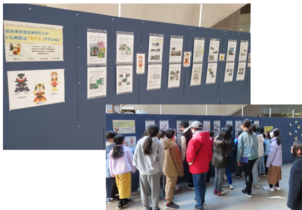
若林区中央市民センター