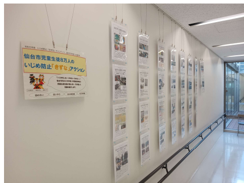
宮城野区中央市民センター