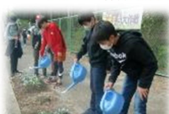
通学路の花壇の水やり

学校の花壇には、春と秋の2回、花を植えています。今年は、春に、マリーゴールドやブルーサルビアなどを植え、秋に、ビオラやノースポールを植えました。環境委員会の子供たちが交代で朝や、休みに水やりなどのお世話をしました。植え替えの際には、花壇の整備や、チューリップの球根取りなどの作業も行いました。