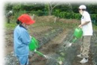
学校農園の水やり