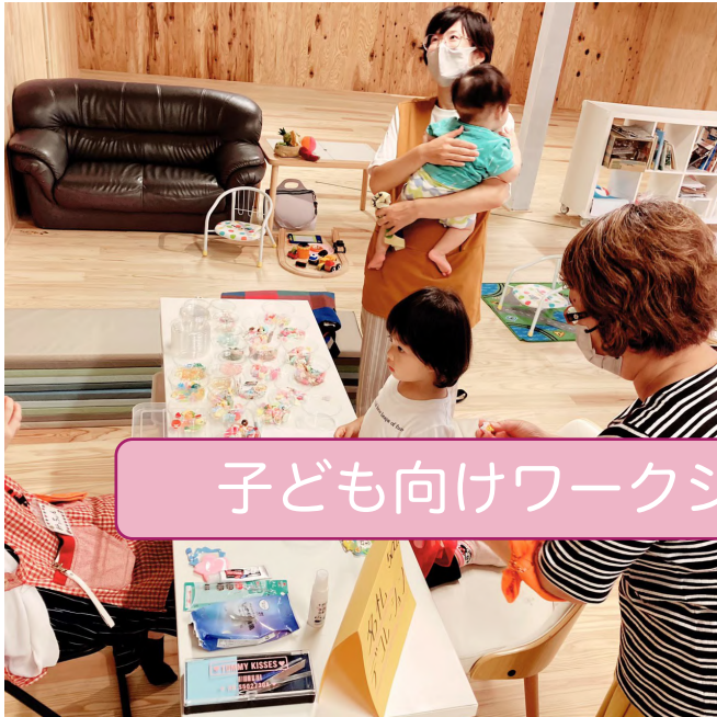
子ども向けワークショップ