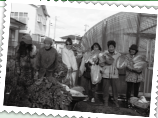
住人の方の畑で収穫のお手伝い。大収穫！

自治会の仕事としてまず最初に取り組んだのは名簿づくり。「4人の中に町内会の役員経験者はいなかったため、何でも1から始めなければなりませんでした。」