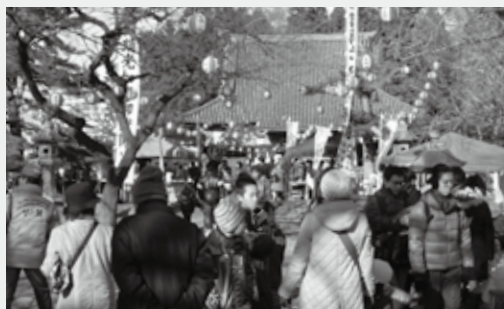
▲「手づくり市」の日は、境内にさまざまなブースが並びます

毎月八日はご本尊のご縁日にあたり、大護摩祈禱が行われ、この日に参拝すると大きな功德が得られるとされています。また境内では市内外の生産者、加工者が直接販売を行う「お薬師さんの手づくり市」が開催され、食品や雑貨を提供する小さなブースが前後軒を連ねます。農産品、お菓子やパン、雑貨など、商品はどれも心を込めて作られた品ばかりです。作り手の思いが感じられる温かい掘り出し物を探しに行きませんか。