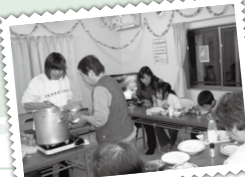
紅白を見ながら「年越しラーメン」

の場で即席の料理講座に発展することもしばしばとか、昨年大晦日には、1人暮らしの方も家族連れも一緒に新年を迎えようと、年越しそばならぬ「年越しラーメン会」を開くなど、時には母のように、時には娘のように、お住まいの方に親身になって寄り添う役員さんの気配り力で、集会所は皆さんの憩いの場へと変身しました。