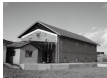
▲クラブの活動拠点となっている味噌蔵。石造りで頑丈なため津波での損壊を免れ、流されてきた大量のがれきをせき止めました

一九五二年に建てられた石造りの 味噌蔵は津波にびくともしなかつた ものの、その周囲の民家は軒並み大 きな被害を受けました。また家屋の みならず田畑の被害も甚大で、多く の地区農家の方々が昨年同様、今年