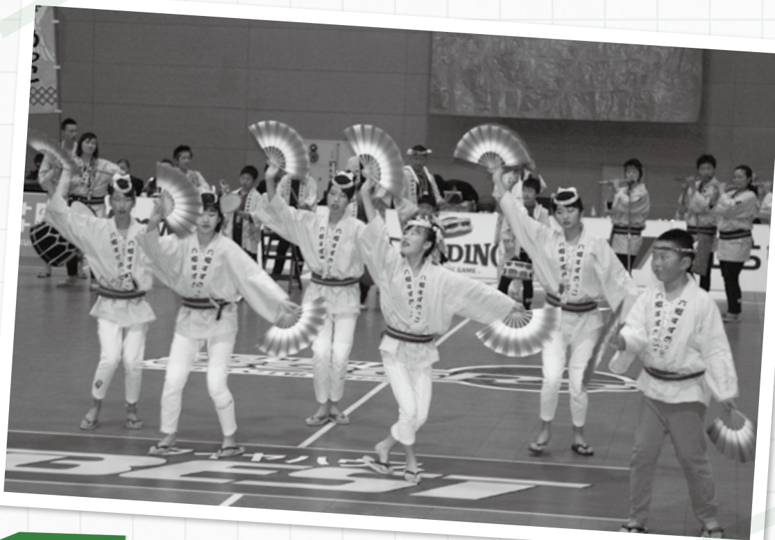
◀「六郷すずめっこ」の踊りとお囃子に、場内から大声援が飛び交いました。この日の出演者を含めて「六郷すずめっこ」は約60名で構成されています

「みらいん」は、 震災からの復興に向けて 歩むまち・仙台の“ひと”と“地域”の 今を結ぶ情報紙です。