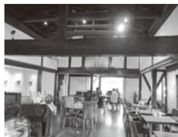
太い梁が印象的な店内。音響設備も揃っており、貸し切りでの催事は年間150回にも及びます

二階の床を取り払って吹き抜けにしたり。古くは材木屋だったという建物は世紀を超えて、約三十席の飲食空間として新たな輝きを得ました。