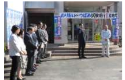
出発セレモニーの様子

3回目の試験運行でも、お食事ツアーやお出かけツアーを開催予定です。実施については、包括支援センターや社協サロン、老人クラブ等各団体へお問い合わせください。