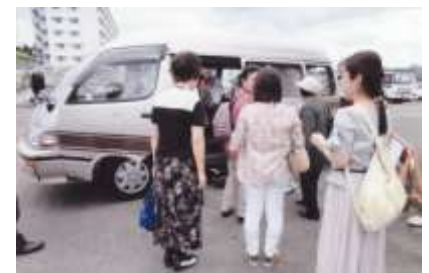
2回目試験運行時の お出かけツアーの様子

発行：燕沢地区交通検討会(燕沢学区町内会連合会、燕沢地区社会福祉協議会、燕沢地域包括支援センター)