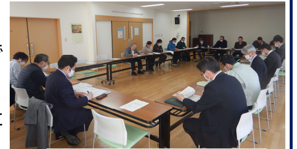
20名が出席した代表者会の様子