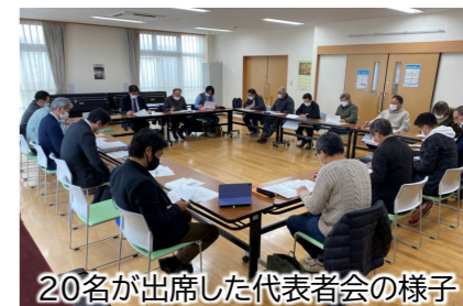
20名が出席した代表者会の様子