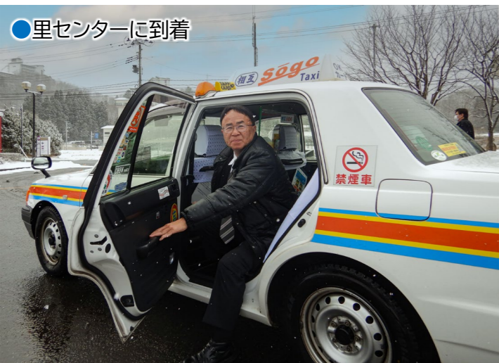
●里センターに到着