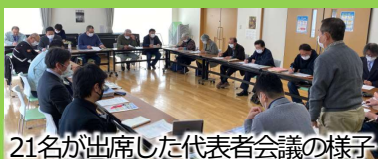
21名が出席した代表者会議の様子

3月16日に、今年度最後の考える会代表者会議を開催しました。会議では、現在までの利用状況及び収支の確認のほか、今回の試験運行の総括として、良かった点や今後の課題について意見交換しました。