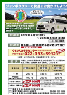
新リーフレット表紙