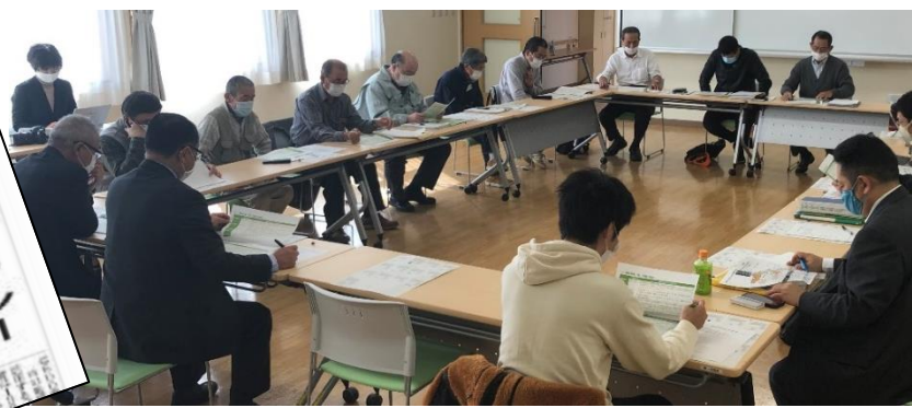
委員12名が参加した10月代表者会議の様子