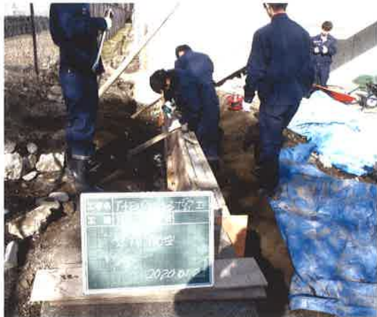
授業風景：3年擁壁作成実習