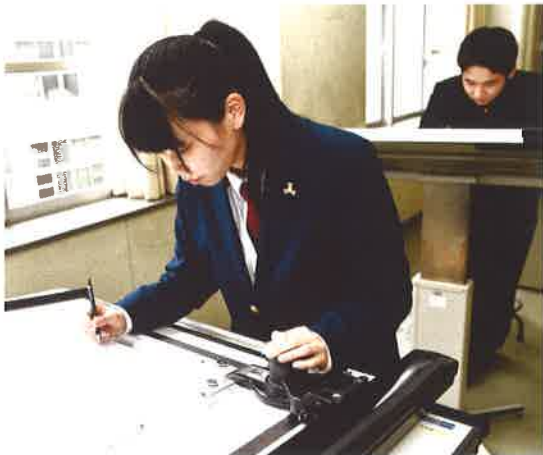
授業風景：3年建築設計製図