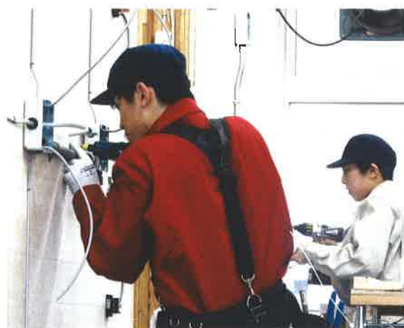
ものづくりコンテスト《電気工事部門》