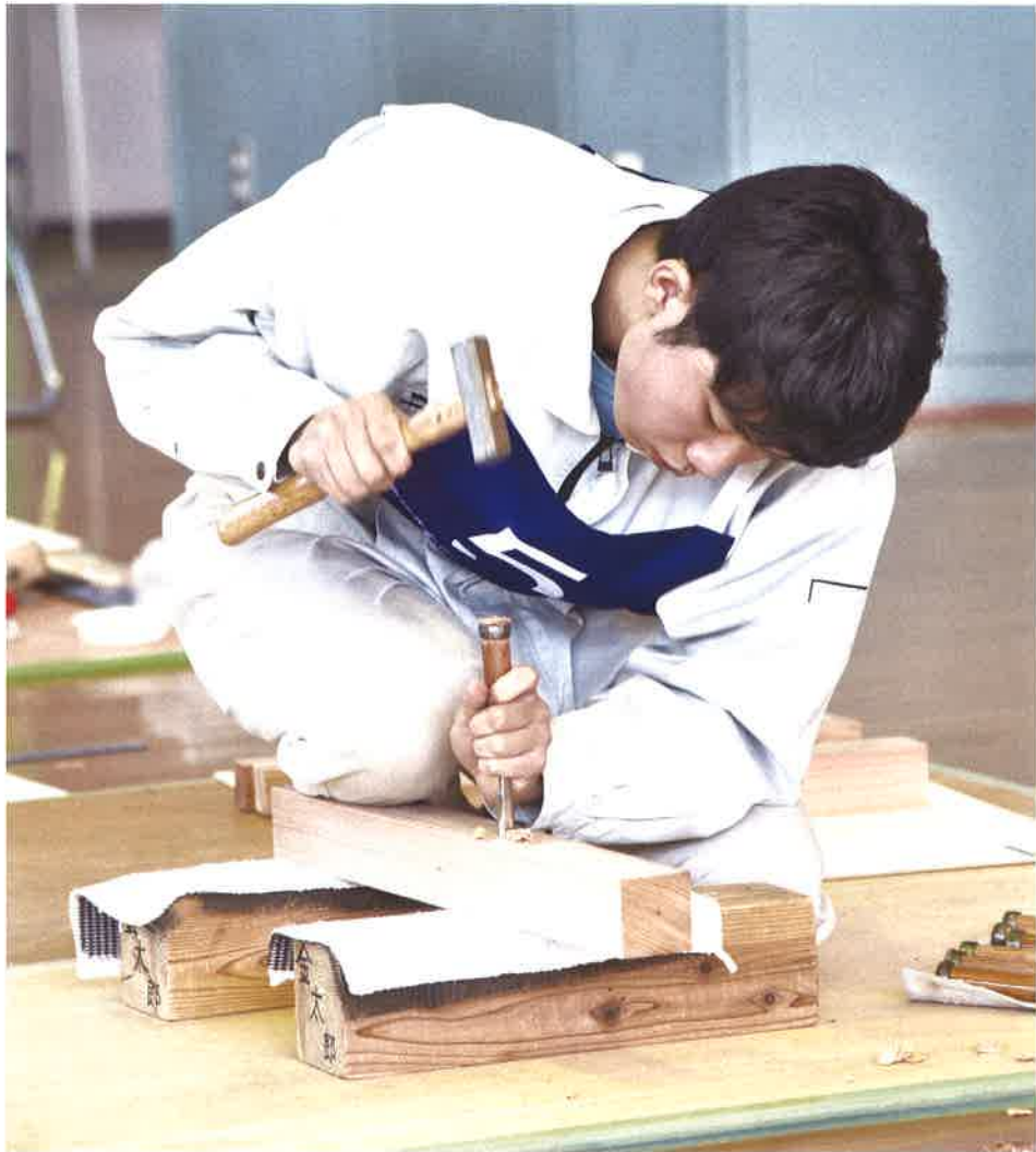
ものづくりコンテスト 宮城県大会《木材加工部門》

住宅、学校、病院、マンション、高層ビル建築、都市計画、都市再開発など、建築物や街は、人々の生活と大きな関わりをもちながら存在しています。主に、建築物はどのように設計され、建てられるかなどについて、基礎的基本的な知識や技術・技能を専門教科の講義とともに実験・実習の体系的な学習を通し、技術者としての倫理感を育てながら、新しい技術に対応し得る能力を養います。