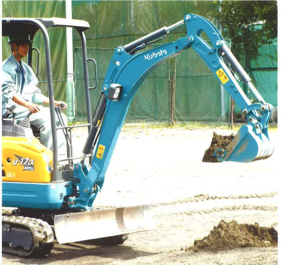
授業風景：2年建設機械実習

土木科では、“積極的に社会貢献ができる人材”や“震災復興の担い手”となる技術者の育成を目指し、専門科目を通して土木技術の基礎について学習していきます。