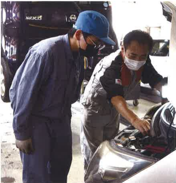
2年インターンシップ

生産の基礎になる機械分野について、基礎的・基本的な知識や技術・技能を学びます。(機械加工実習、溶接実習、鋳造・鍛造実習、機械製図等)。また、近年の産業現場における自動化・省力化にともない、メカトロニクス分野でも活躍できる能力を養います。(自動制御実習、電気・電子実習、NC実習等)