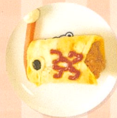
子どもの日 (こいのぼり)