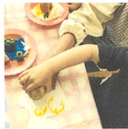
野菜でペッタン絵