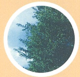
自然とのふれあい