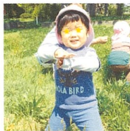
薬師堂へおでかけ