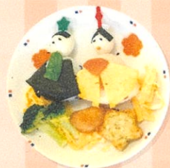
桃の節句 (お雛さま)