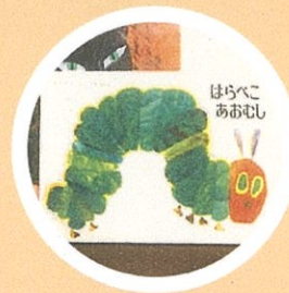
絵本のよみきかせ