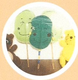
わらべうたあそび