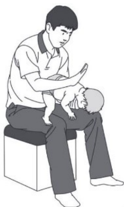
図 1. 乳児に対する背部叩打

反応がなくなった場合は、まだ通報していなければ 119 番通報し、次に乳児を床など硬いところに寝かせ、心停止に対して行う心肺蘇生の手順を開始します。心肺蘇生を行っている途中で異物が見えた場合は、それを取り除きます。見えない場合にはやみくもに口の中を指で探らないでください。また異物を探すために胸骨圧迫を長く中断しないでください。