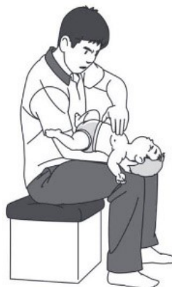
図 2. 乳児に対する胸部突き上げ