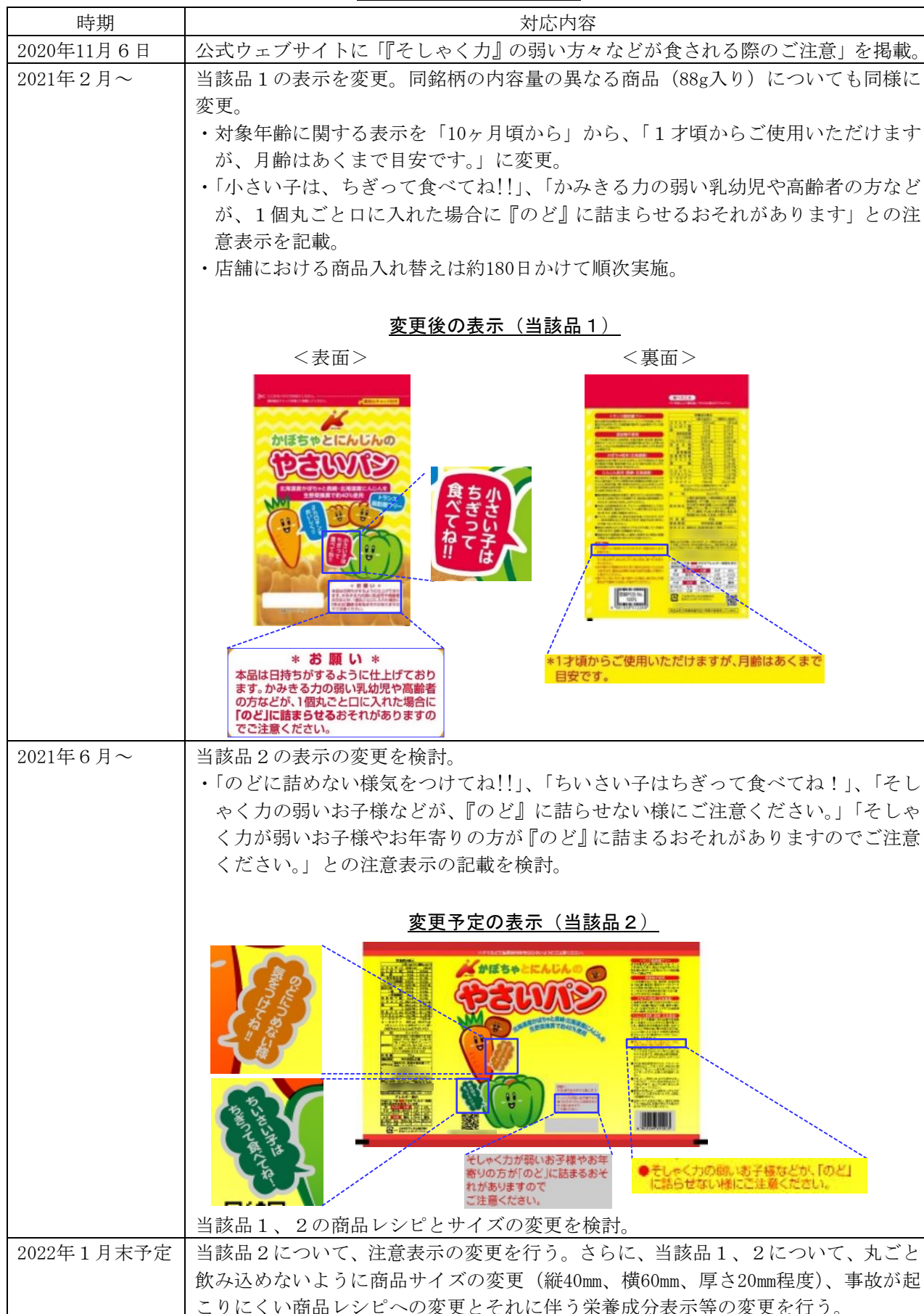
表2. 製造事業者の対応