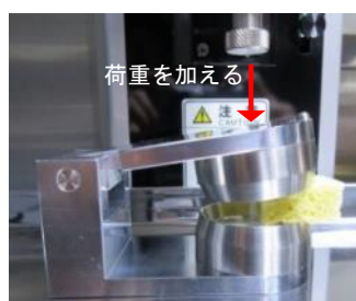
写真5. テストの様子