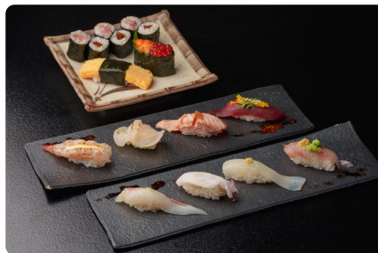
ひと手間加えた寿司を楽しめる「おまかせにぎり(1,650円)」

HPや看板でのPRが奏功し、テイクアウトは好調です。近隣の会社からの問い合わせも増え、学生のお客様からの注文も少なくありません。若い世代にとっては寿司といえば回転寿司ですが、価格を明示したことで「その金額なら頼めるかも」と興味を示してくれる方も多いです。