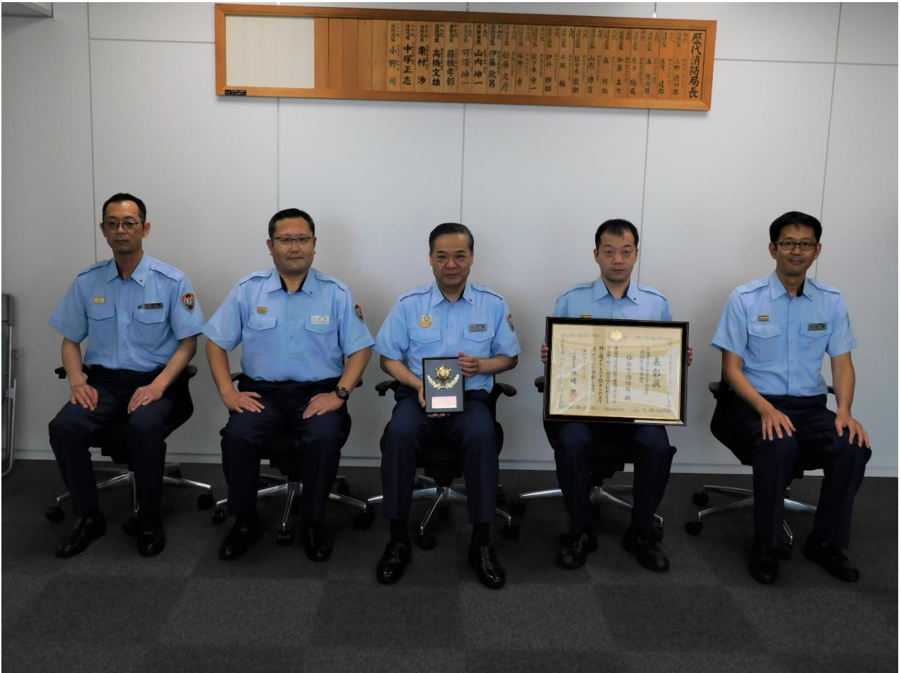
第4回予防業務優良事例表彰「消防庁長官賞」受賞 【消火器・誘導標識点検アプリ『KIKATTO～キカット～』】