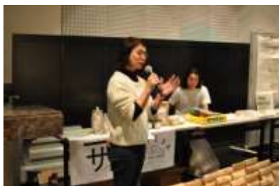
ブース出展者と意見交換