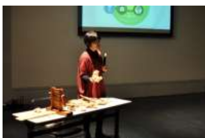
綿花と綿繰り機の紹介