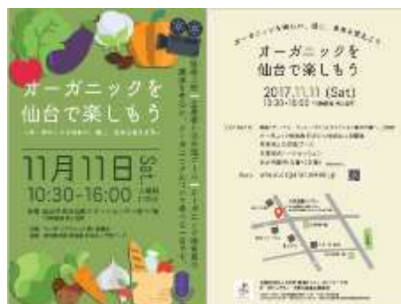
A4 イベントチラシ（表/裏）