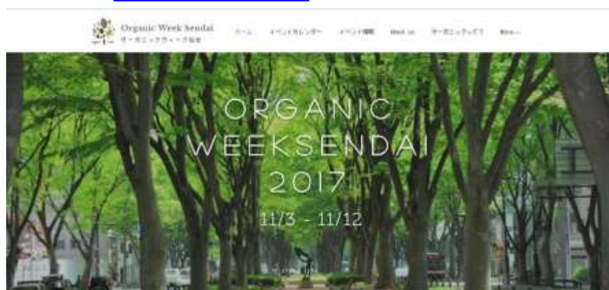
オーガニック・ウィーク・センダイ 2017 WEB サイトトップページ

【WEB】ホームページ作成ツール「Wix」を利用し、2017年用のWEBサイトを作成。独自ドメインを取得（ www.organicweek.jp ）し、イベント告知やコラムを掲載。