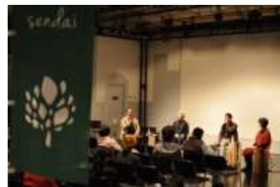
会場内にはのぼり旗を掲示