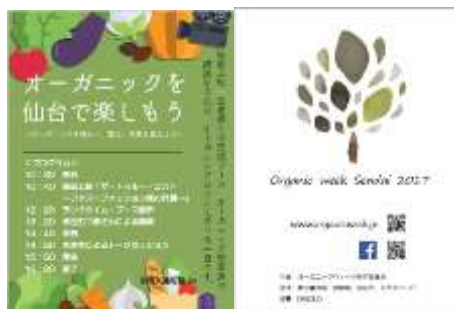
A5 当日プログラム（表/裏）