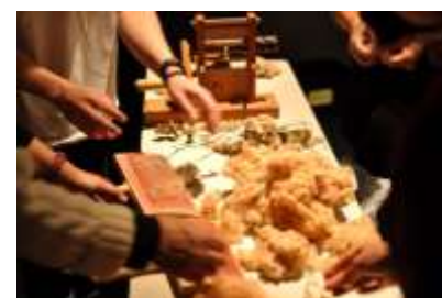
綿繰り機の操作体験