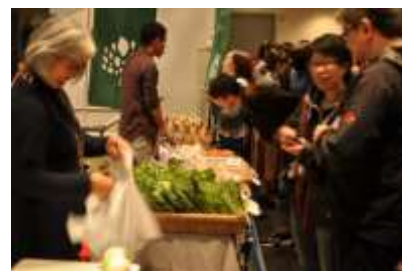
来場者と生産者の交流