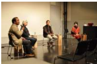
同じ目線でトークセッション

【内容】自己紹介を兼ねたオーガニックに対する思いの話しにはじまり、オーガニック認証の話や、その必要性、メリットとデメリットについて話された。会場とのやりとりもあり、オーガニックに対する様々な意見交換がなされた。