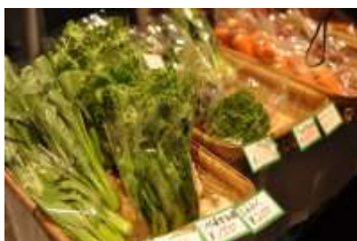
生産者による販売