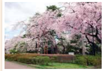
保存樹木のシダレザクラ