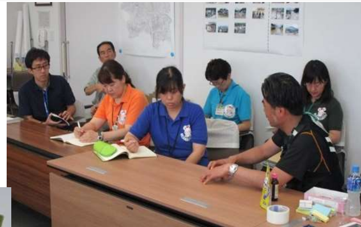
東日本大震災 仙台市震災記録誌