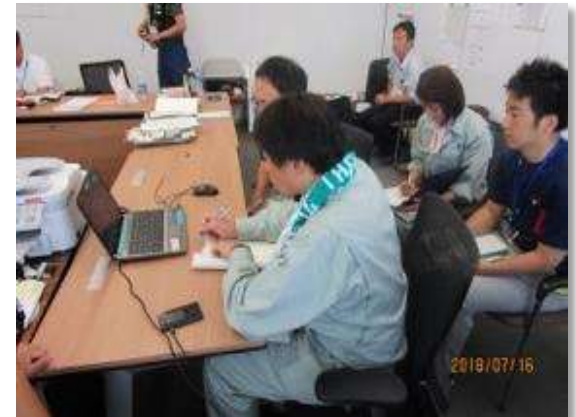
テレビ会議の様子