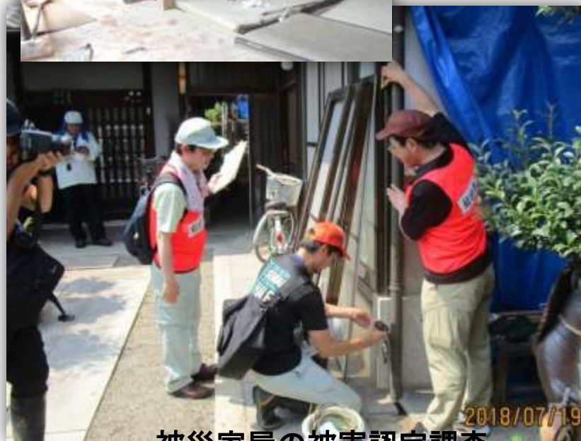
被災家屋の被害認定調査