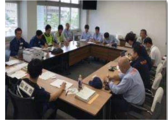
支援自治体調整本部会議