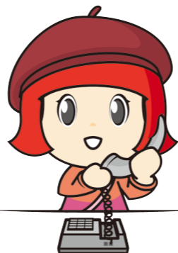
マスコットキャラクター ざっち