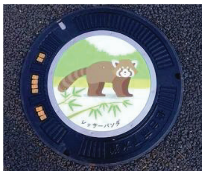
デザインマンホール