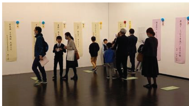
下水道フェア事業「くらしと水」川柳コンクール