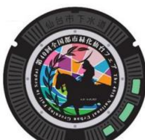
追廻地区の設置例