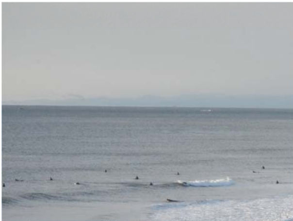
サーフィンをする利用者（調査時期：冬季）