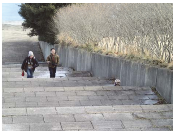
犬と散歩する利用者（調査時期：冬季）