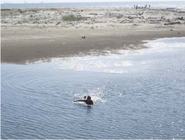
サーフィンをする利用者（調査時期：夏季）