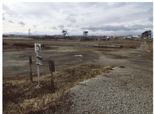
④ 日和山周辺工事状況