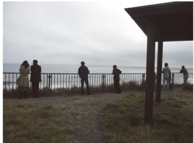
サーフィンや景色を眺める利用者（調査時期：秋季）