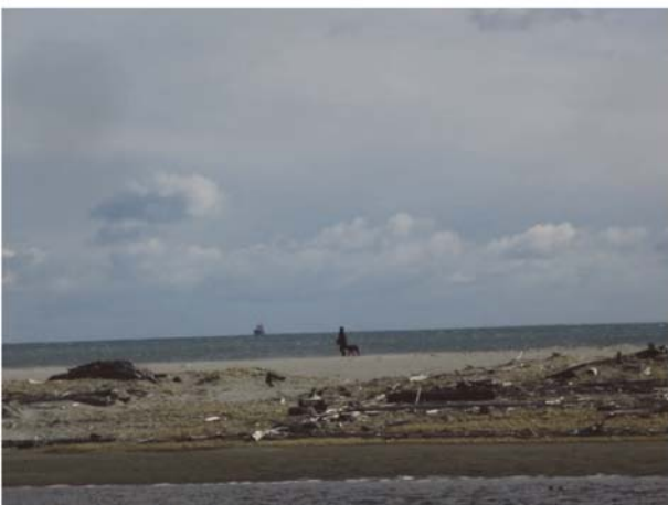
犬と散歩する利用者（調査時期：冬季）