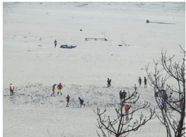
砂遊びや散歩をする利用者（調査時期：春季）