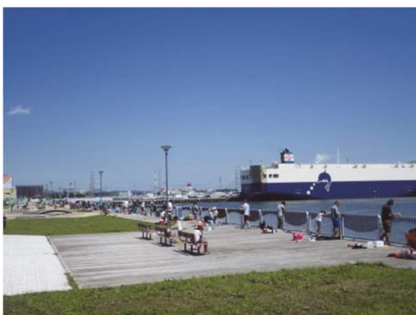
釣りをする利用者（調査時期：夏季）