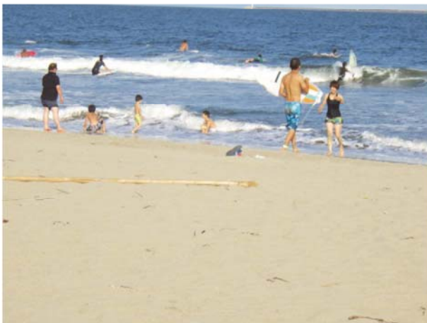
水遊びをする子供たちやサーフィンをする利用者（調査時期：夏季）