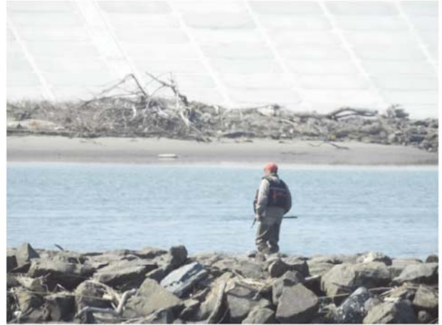
釣りをする利用者（調査時期：春季）