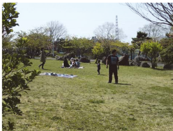
ピクニックする親子連れ（調査時期：春季）