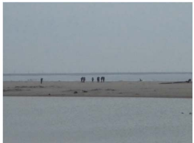
バードウォッチングをする利用者（調査時期：秋季）