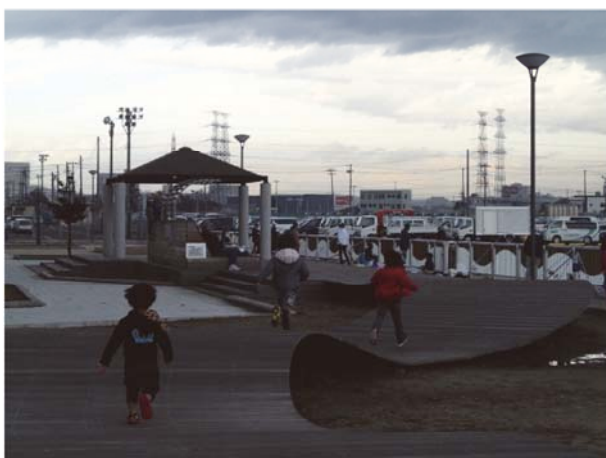
海の広場で遊ぶ子供たち（調査時期：秋季）