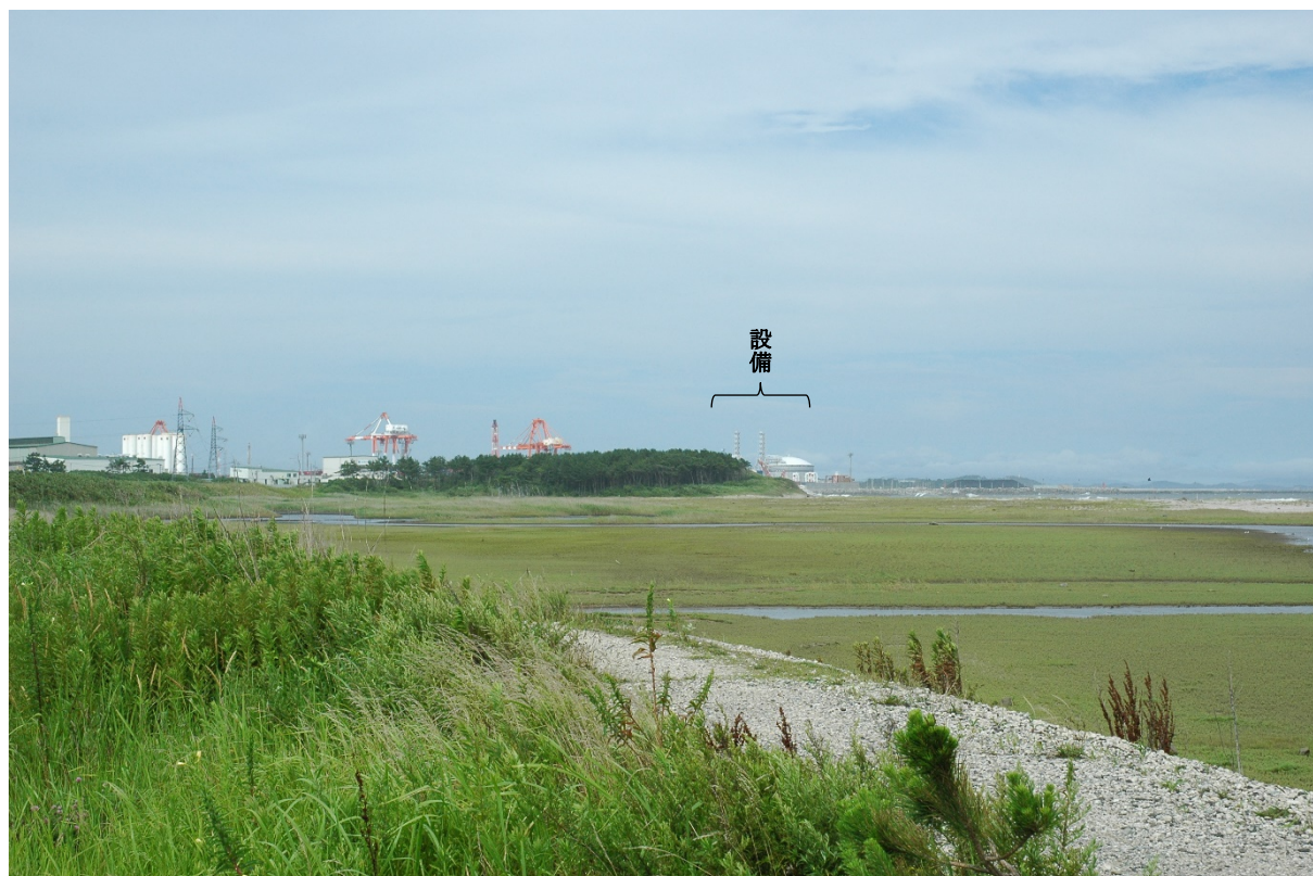
現状 (撮影日：令和3年8月2日)