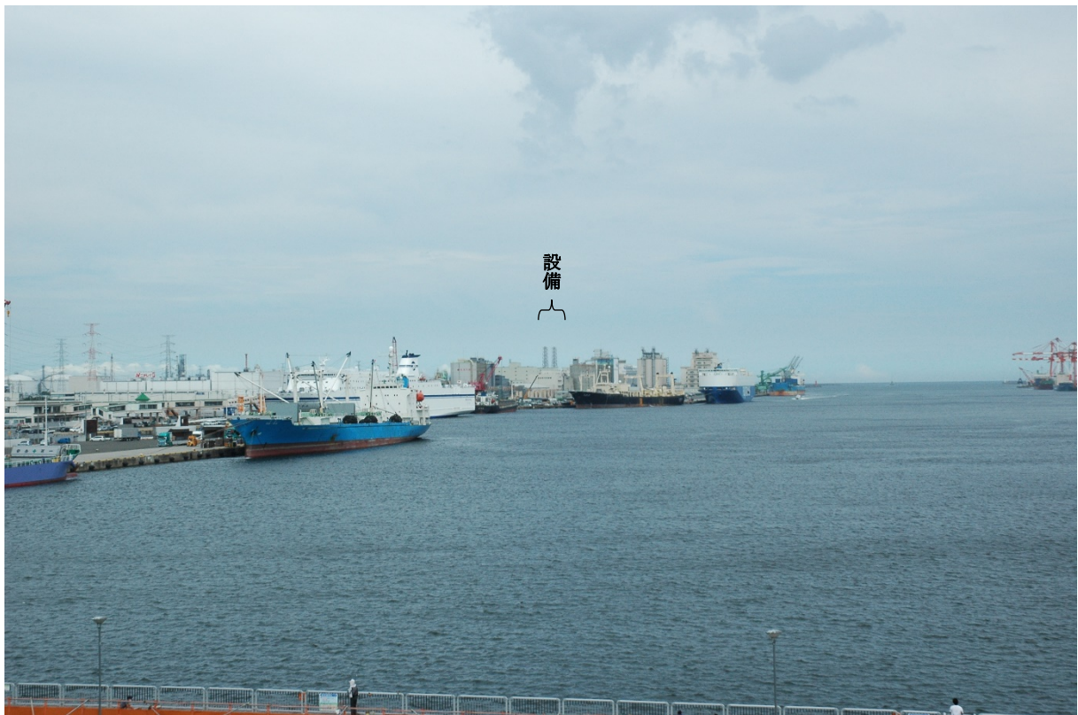
現状 (撮影日 : 令和 3 年 8 月 2 日)