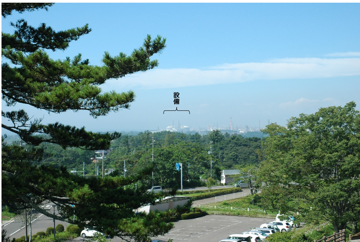
現状 (撮影日：令和3年8月2日)