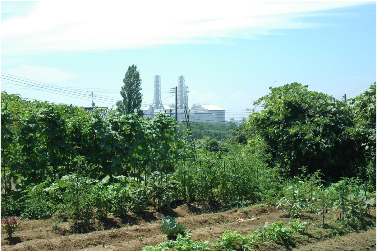
地点を移動して撮影（撮影日：令和3年8月2日）