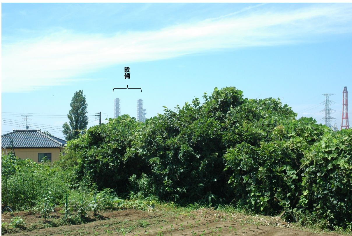
現状 (撮影日：令和3年8月2日)