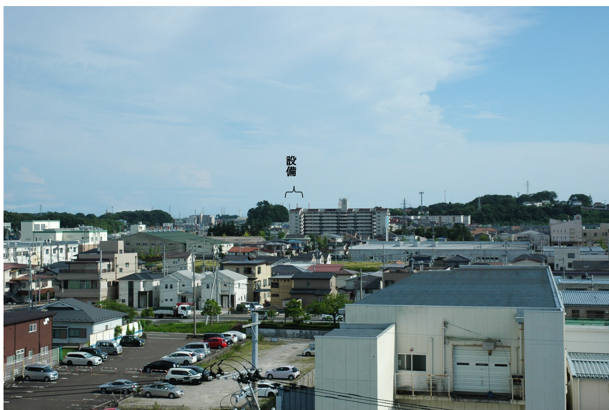
現状 (撮影日: 令和3年8月2日)