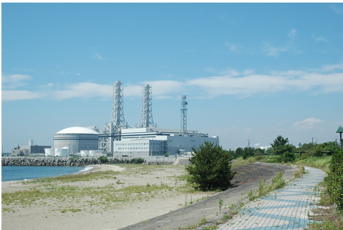
現状 (撮影日：令和3年8月2日)