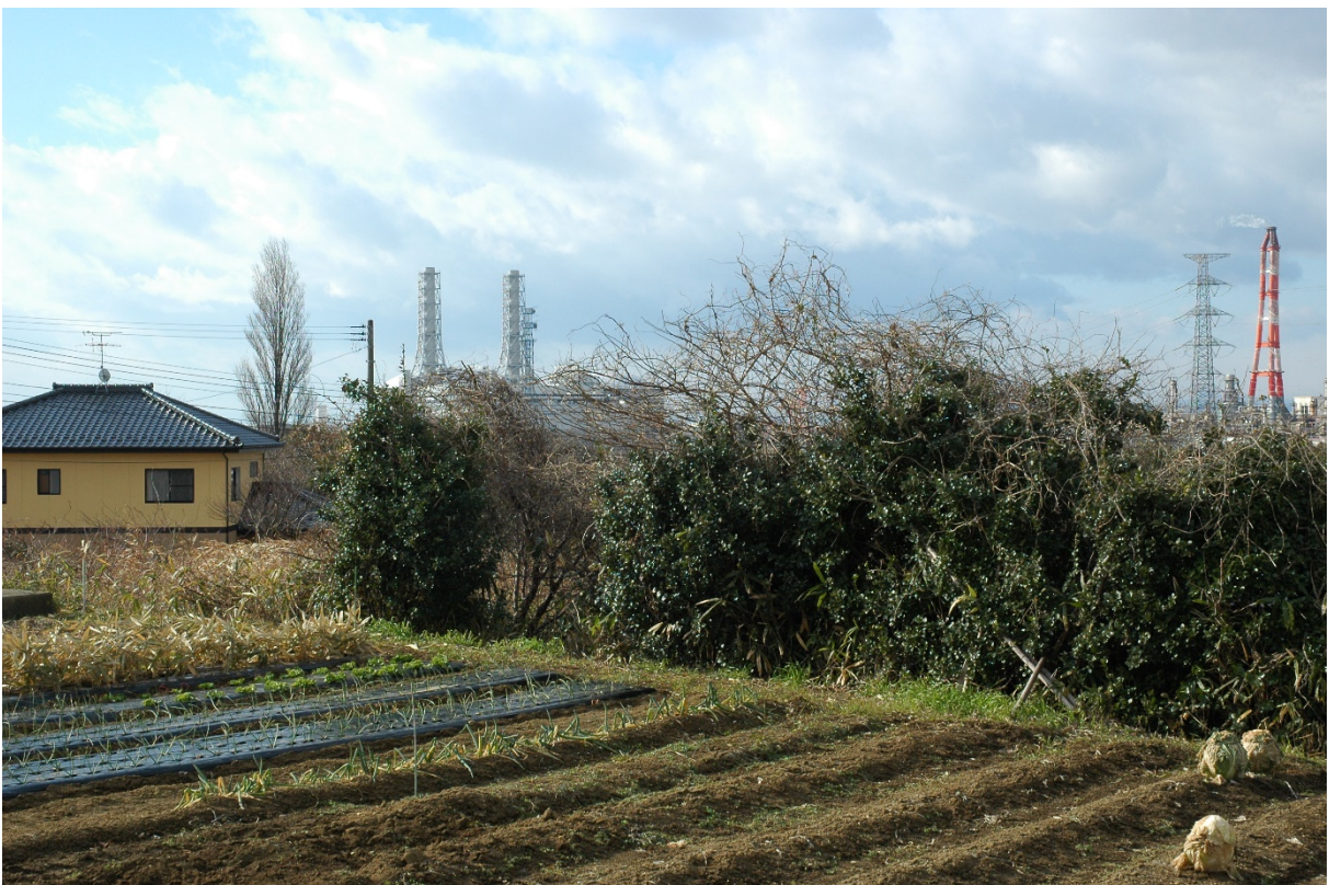
冬季（撮影日：令和4年1月17日）