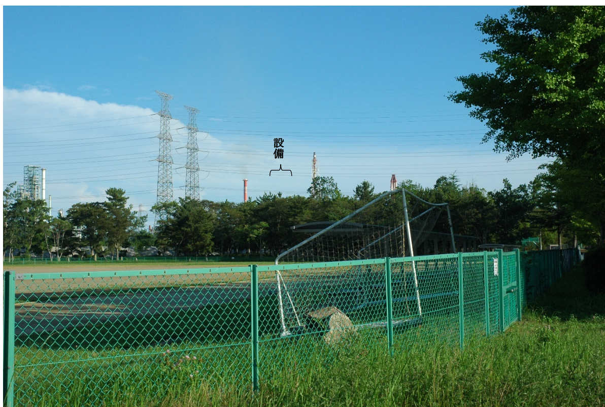
現状 (撮影日: 令和 3 年 8 月 2 日)