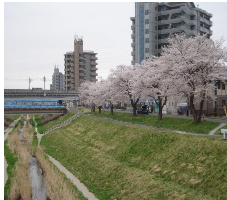
富沢包括版認知症ケアパス