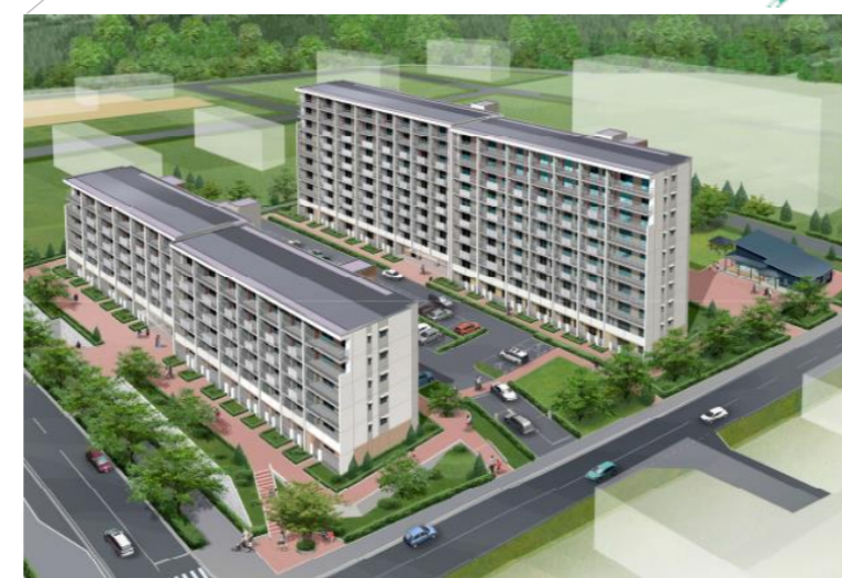
鶴ヶ谷第二市営住宅団地再整備事業