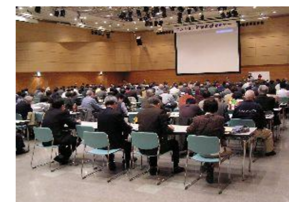
マンション管理基礎セミナー事業