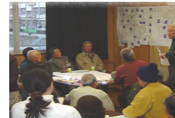
まちづくり支援専門家派遣事業