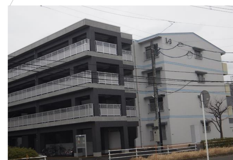
高砂西市営住宅 EV設置工事