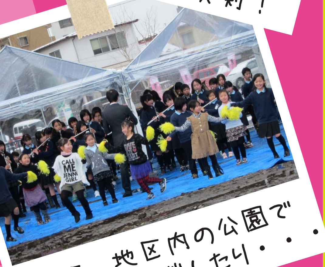
さらに、地区内の公園でイベントを開催したり...