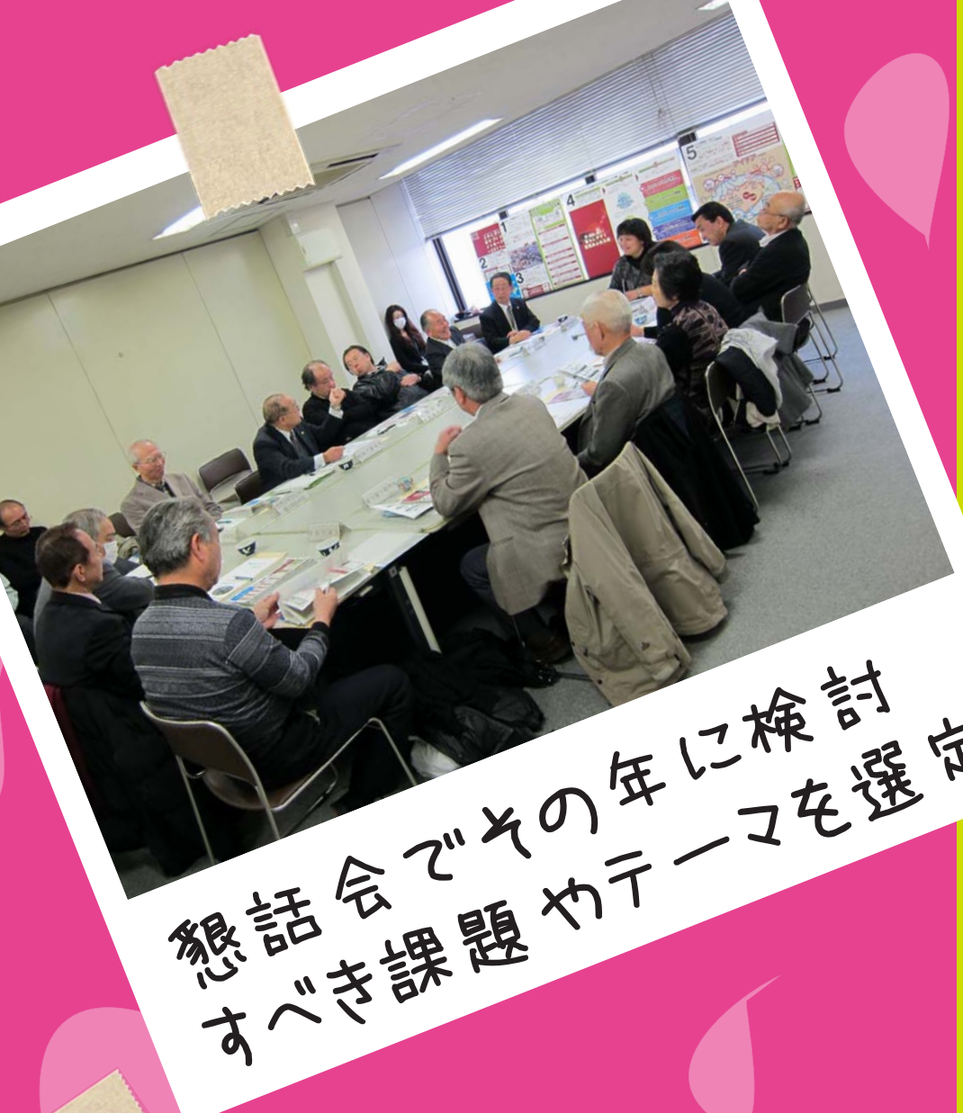
懇話会でその年に検討すべき課題やテーマを選定