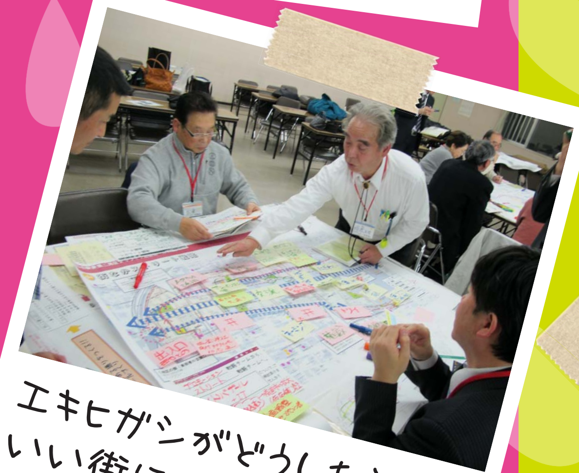
エキヒガシがどうしたらもっといい街になるかに真剣！