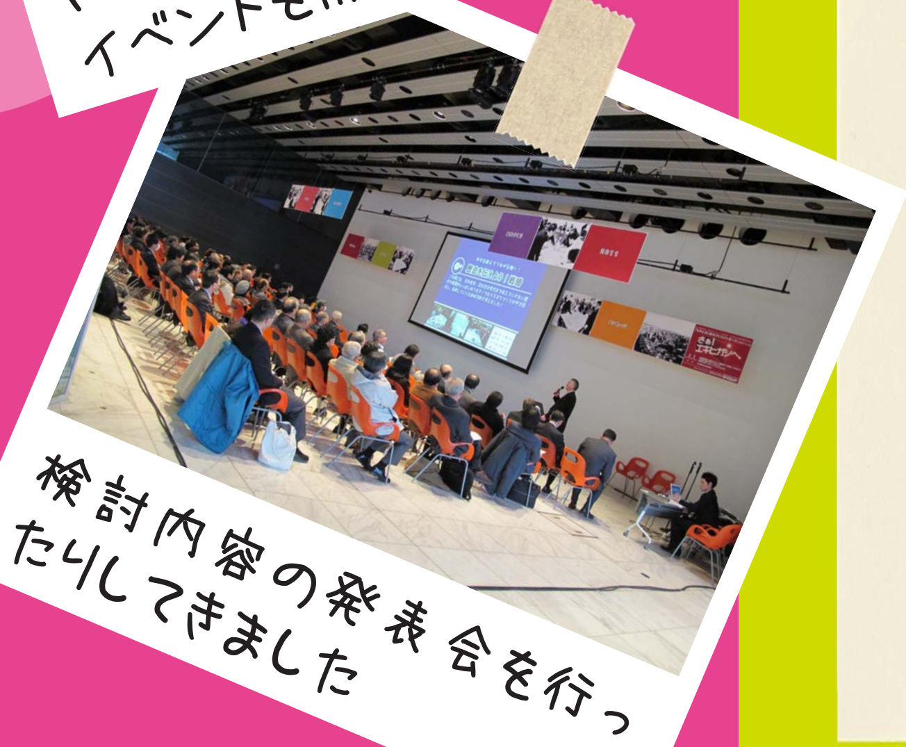
検討内容の発表会を行ったりしてきました