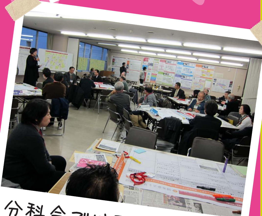
分科会ではワークショップ形式で各テーマを検討