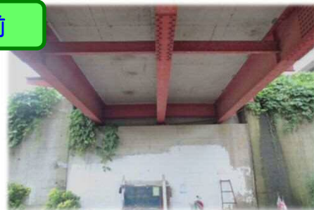
▲地震による落橋のリスク