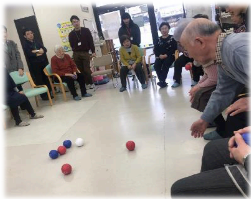
↑レクリエーション