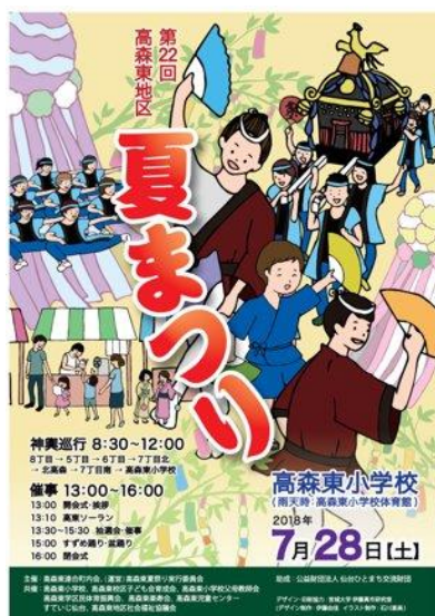
第 22 回高森東地区 夏祭り 実施日:平成 30 年 7 月 28 日(土) 納品枚数 A4 230 部、A2 35 部