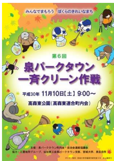
第 6 回泉パークタウン一斉クリーン作戦 実施日:平成 30 年 11 月 10 日(土) 納品枚数 A4 830 部、A3 15 部、A2 74 部