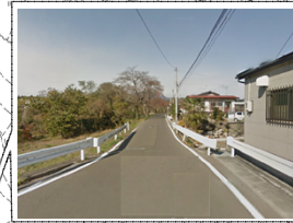
既存道路の拡幅・嵩上げ区間・・・③