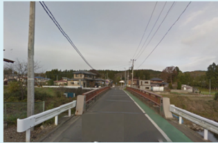
【現馬橋】 幅員構成イメージ