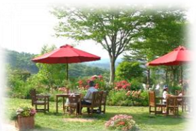
みどりのある空間で寛ぎある食体験の提供