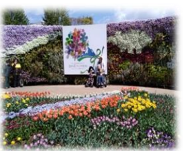
フォトジェニックスポットの設置