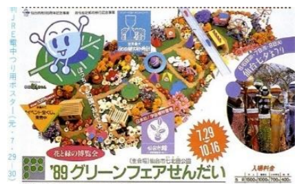
第7回'89グリーンフェアせんだい