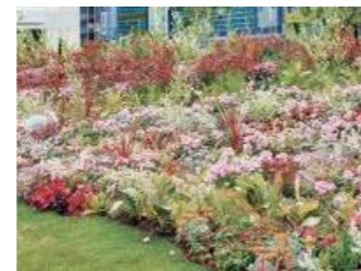
第37回ひろしまフェア