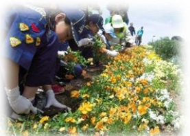
子どもたちや市民との会場づくり