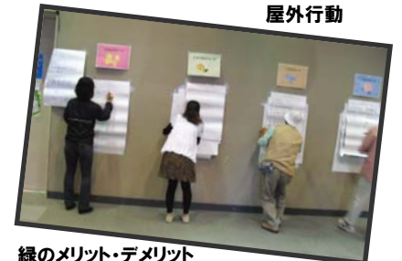
緑のメリット・デメリット