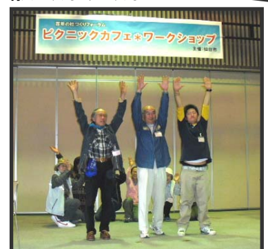
仙台市百年の杜ビジョン CM