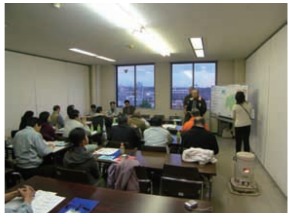
公園づくりのワークショップの様子（（仮称）齋勝沼緑地）