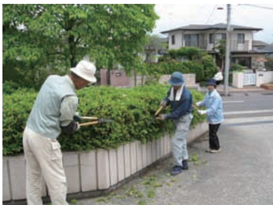
緑の活動団体の活動状況 1 (長命ヶ丘剪定ボランティアの会)

緑の活動団体をはじめ、みどりに関わる市民団体や市民の意識啓発、学習の機会の提供などを行い、みどりに対する理解を深めるとともに、活動に関する支援を行います。