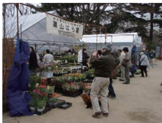
植木市の実施状況