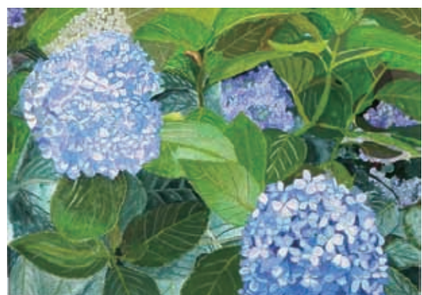
絵画コンクールの受賞作品 平成 23 年度小学校中学年の部 (仙台市長賞)