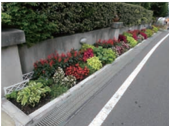
花壇コンクールの受賞作品 (中山パーク・ホームズ丘の街町内会) 平成 23 年度最優秀賞 (仙台市長杯)

みどりの保全、創出または普及に関し、顕著な功績があった個人や団体を表彰し、みどりの活動に関する意識を高めます。