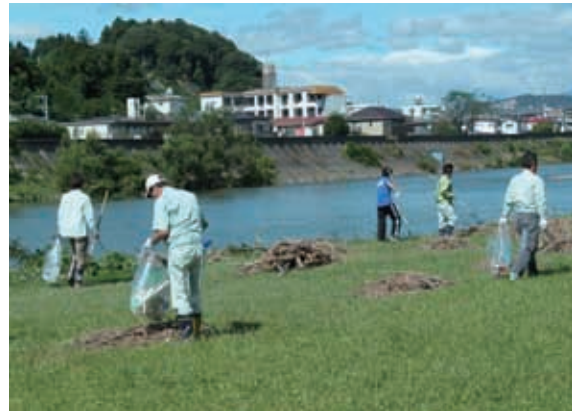
広瀬川1万人プロジェクト活動状況