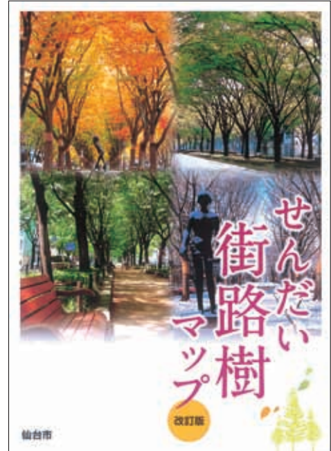
仙台街路樹マップ