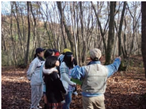
太白山自然観察の森

誰もが主体的に、また気軽にみどりの保全、創出に取り組めるよう、みどりにふれあえる場を提供します。