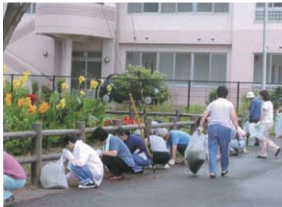
公園愛護協力会の活動状況

良好で使いやすい公園づくりを進めるため、公園整備や公園の維持管理、運営に、市民や事業者が参加できる機会を設けます。