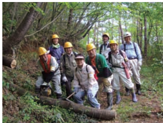
緑の活動団体の活動状況 2 (権現森自然研究会)