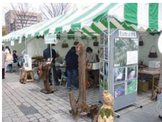
新緑祭の実施状況

みどりの復興やみどりに対する愛着や関心を深めるため、各種イベントなどの実施を行い、みどりにふれる機会を創出するとともに、市民によるイベントなどに対する支援を行います。