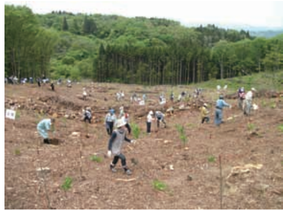
みんなの森づくり事業の実施状況（坪沼市有林）