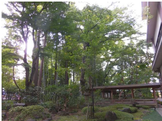
(敷地南側の樹林内の様子(東側))