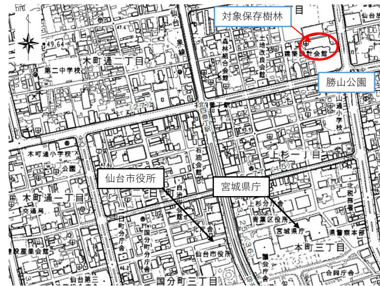
図1 審議対象保存樹林の位置