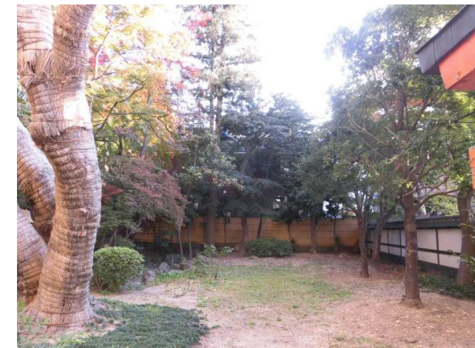
(敷地南側の樹林内の様子(西側))