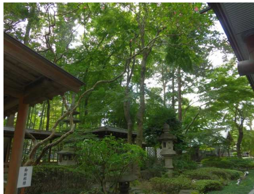
(敷地南側の樹林内の様子(中央))