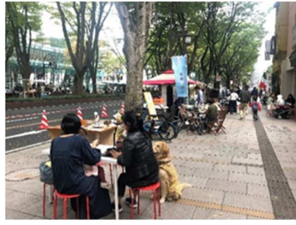
道路空間利活用の社会実験