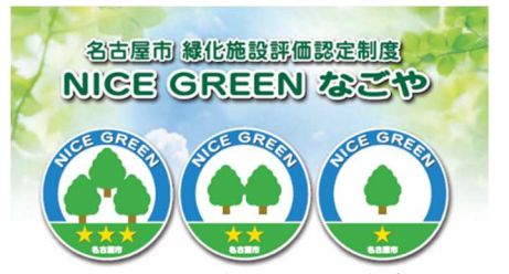
名古屋市 緑化施設評価認定制度