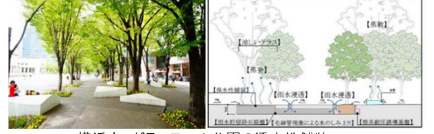
横浜市 グランモール公園の透水性舗装