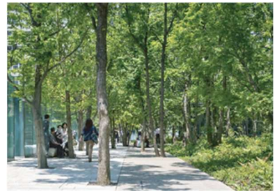
「大手町の森」大手町タワー（東京都千代田区）