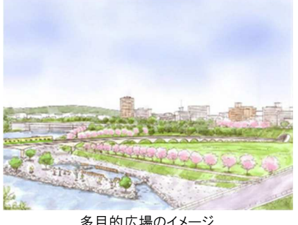
多目的広場のイメージ