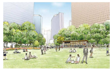
「新宿中央公園魅力向上推進プラン」より取組み例の一部