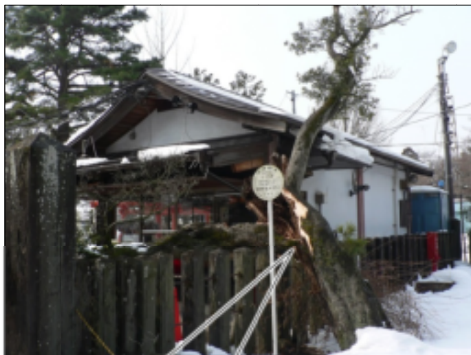
降雪による被害状況 (平成 26 年 2 月)