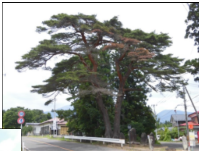
枝枯れ状況 (平成 30 年 7 月撮影)