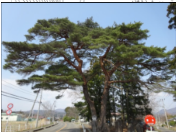
保存樹木【福岡の赤松】 （平成28年3月時点）