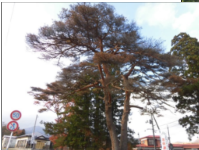
松枯れ状況 (平成 30 年 11 月撮影)