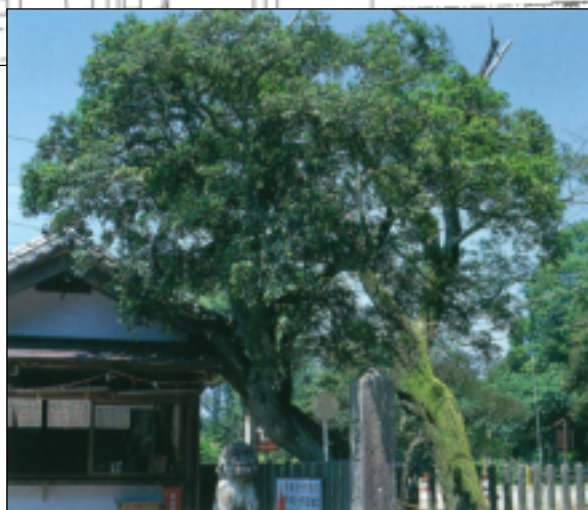
保存樹木【薬師堂のひいらぎ】