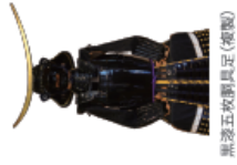
黒漆五枚胴具足(複製)

仙台市博物館は、伊達政宗をはじめ仙台の歴史や美術、文化にかかわる様々な資料を所蔵しています。改修工事のため令和5年3月(予定)まで休館中ですが、「黒漆五枚胴具足 伊達政宗所用(複製)」やパネル展示を通して仙台の歴史の一端をご紹介します。