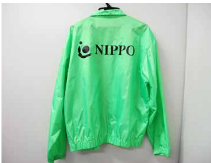
清掃活動の日に着用しているユニフォーム。「NIPPO」のロゴが際立っています。