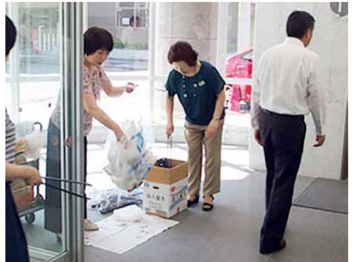
事業所のビル1階エレベーターホールに用具を準備。ここから、ふた手にわかれてスタートします。