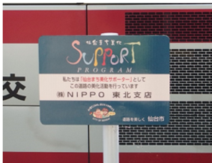
晩翠通に設置されている、(株)NIPPOが「仙台まち美化サポーター」として活動していることを示す立て看板。