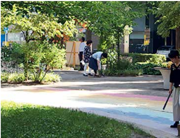
ポイ捨てごみが多い植え込みは、丹念に清掃します。

夏の暑い時期以外は、背中に「NIPPO」と書かれた緑色のユニフォームを着用。清掃活動を行っていることを周囲に知らせることで、少しでも「ポイ捨て」の抑止になるよう配慮しています。毎回、系の社員の方が用具を準備。軍手とごみ袋、火ばさみを手に、黙々とごみを拾うのがNIPPOのごみ拾いスタイルです。