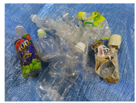
プラスチック資源に混入していたペットボトル