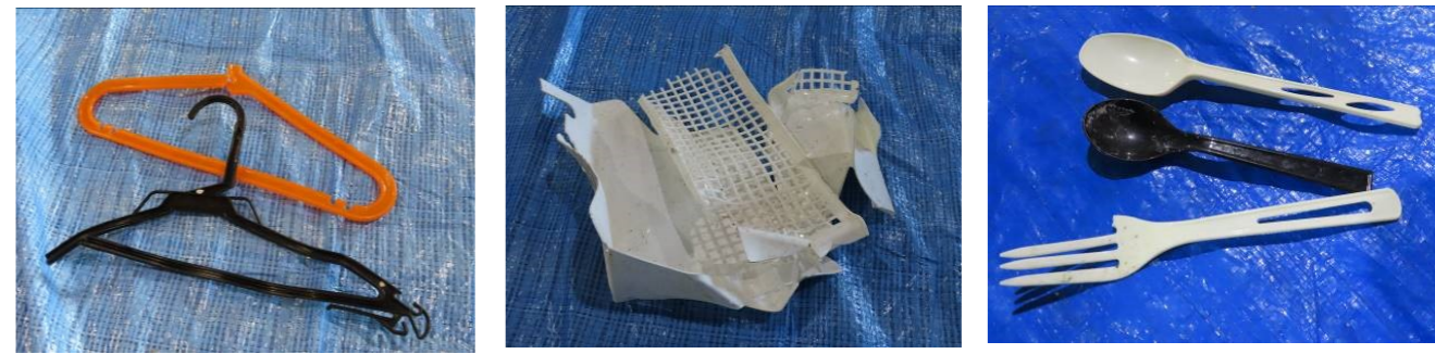
収集された製品プラスチックの例