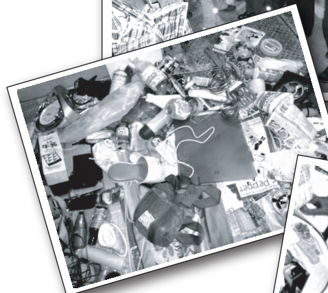
↑本当にいろいろなものがプラと一緒に出されています。