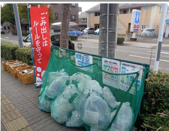
若林区南小泉 4 丁目 17 番地内

今年度も 3 ヲ所挑戦し、認定結果は全て「五 つ星」でした。五つ星集積所は町内 29 ヲ所 になりました。取り組みの成果を、毎年全世帯 に配布する「町内会活動だより」に掲載してい ます。