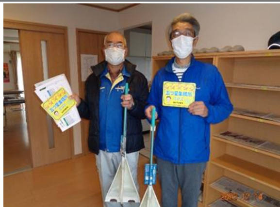
紫山 5 丁目町内会

クリーン仙台推進員とクリーンメイトの方々がごみの適正な排出の為、ごみ集積所を巡回し啓発活動しています。今回、集積所診断を受け、ワケルくんの五つ星評価をいただき町内会の皆さんの協力もあり、町内会としての誇りです。コロナ渦前は、市のワケルくんバスで今泉工場などを見学したり、夏休みには子供会と保護者を対象に、ごみ集積所での勉強会を開催し分別を学び体験しました。これらは、町内会の防犯にも役立っていると思います。