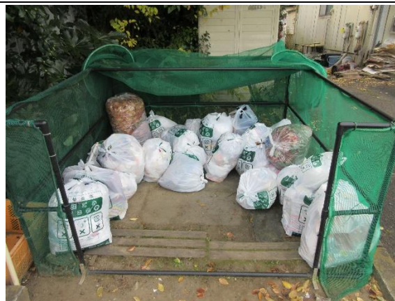
太白区西中田 7 丁目地内

今回五つ星表彰をいただいたのは、環境衛生部の渡辺さんを先頭に役員 11 名の皆さんが、ごみ集積所の整備や月 2 回ほどの不適物の点検など、積極的に活動いただいた結果だと考えております。