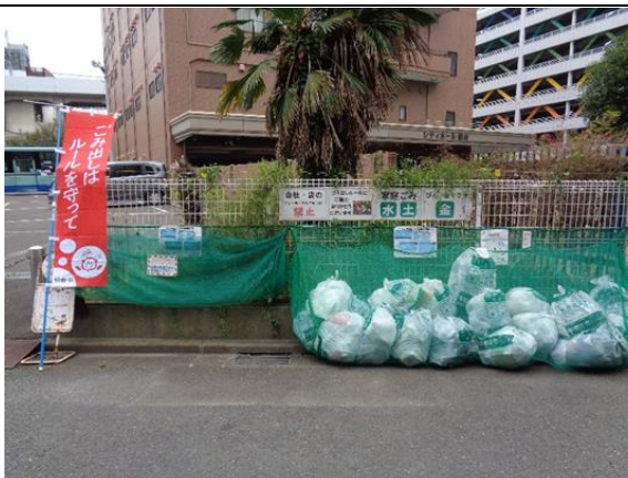
若林区新寺 1 丁目 1 番地内

地域の状態は「ごみ集積所」に表れます。地域の価値を高める為にも清潔で綺麗に、正しく活用される集積所を目指しています。集積所を通じて近隣マンションの管理人や飲食店の皆さんが清掃活動に参加して下さるようになりました。全ての集積所での「五つ星獲得」を町内会の継続目標に設定して、これからも推進員をはじめ地域のみんなで連携を深めながら取り組みます。