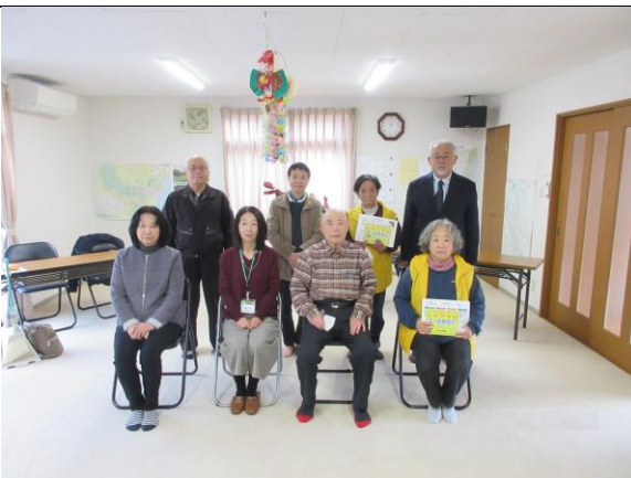
向山経ヶ峯親交会

環境事業所の皆様には、日頃より地域への住み よい町作りにご協力いただき感謝致します。今 後ともご支援のほどよろしくお願い致します。