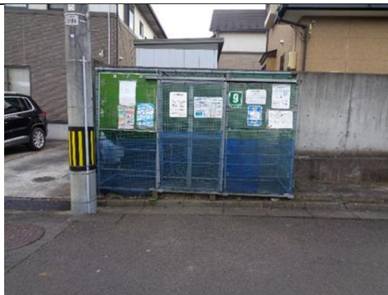
泉区加茂 1 丁目 25 番地内