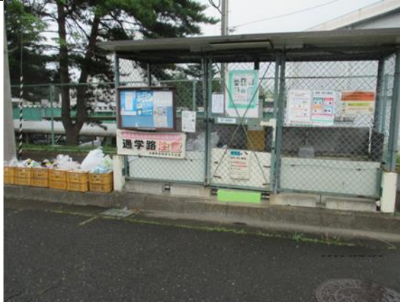
青葉区赤坂 1 丁目地内

週三日、当たり前の様に生活ごみを廃棄し、数時間後ごみは収集され何事も無かったように元に戻る。この当たり前の事業が機能せず、又、滞ったら街中にごみが溢れ、悪臭で生活が成り立たないであろう。私達は収集してくれる皆さんに有難う、御苦勞様と直接声を掛けられないが、せめてごみ出しのルールを守り、集積所を整然と管理する事が大切であると思う。町内会の 8 箇所の集積所のうち、今回 3 箇所が五つ星集積所に認定され計 6 箇所と成りました。今後共、御指導をお願いいたします。