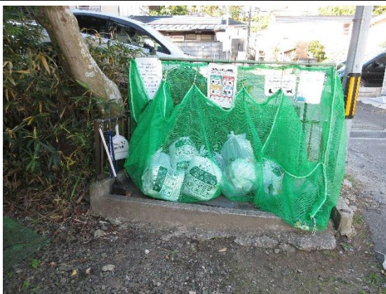
太白区向山 1 丁目地内

この度の五つ星受賞は大変うれしく思いま す。3 年前から挑戦しまして、三度目の正直で 3 か所パーフェクト受賞ということで、これも 役員皆様の努力の賜物として嬉しい限りです。