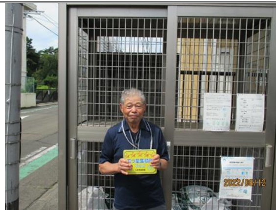
青葉区柏木1丁目4番地内

集積所にカラスが来なくなりましたが、ペットボトルの出し方がまだつぶしてない方が多いです。