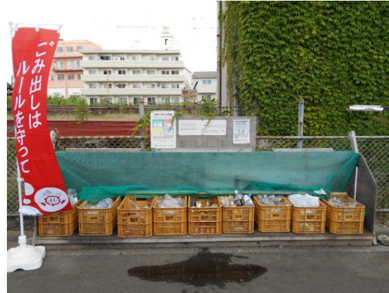
宮城野区平成2丁目19番地内

家からごみを出す時「きれいにしましょう！」との思い・・・ごみ捨て場でもお忘れなく！