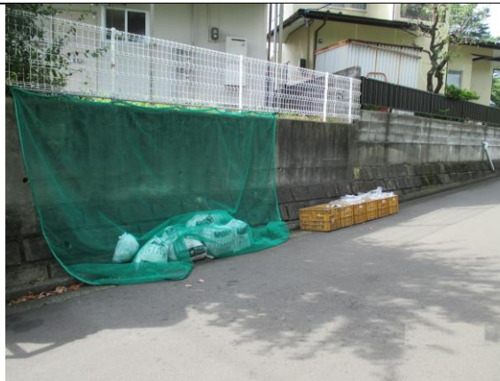
青葉区西勝山37番地内

この度の受賞有難うございました。利用者の皆さんは大変喜んでおります。これから益々きれいに利用していくと思います。当町内会では33ヶ所の内、15ヶ所が五つ星集積所になりましたが、新興住宅が60戸出来て9月末で新入居25世帯増えました。これからは新旧混在の世帯が多くなると思いますので、全集積所が五つ星集積所を受賞出来ます様に環境美化に努めて行きたいと思います。