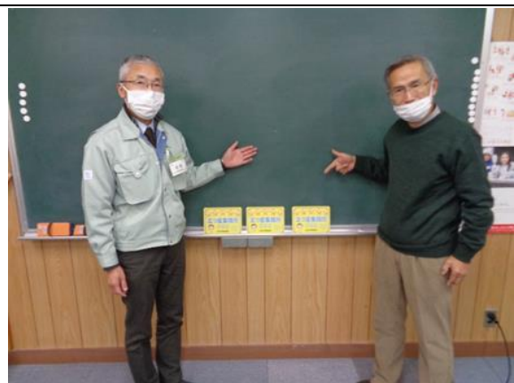
加茂一丁目町内会

ごみの分別習慣は、日常生活の上でとても重要なことです。今後は五つ星の認定で安心することなく、特に資源ゴミの出し方には十分な注意を払って、模範的な地域と言われるようになっていきたいと思っています。