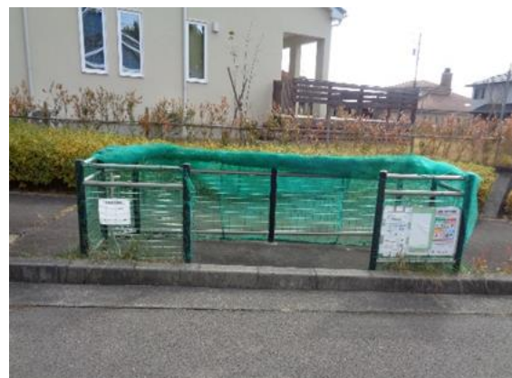
泉区紫山 5 丁目 25 番地内

この取り組みに参加 6 年目にして、当町内会にある 15 箇所の集積所が、とうとう全部五つ星に認定されました。2 年目からは毎年確実に 3 箇所ずつ認定され、町内会全員のご協力により大変誇らしい結果となりました。