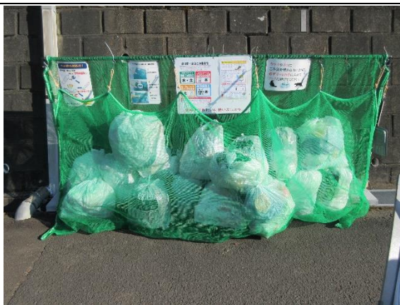
太白区青山 2 丁目地内

この度、弥生青山町内会 3 箇所のごみ集積所 が優良集積所として五つ星の認定を受け、誠に ありがとうございます。この集積所を利用する 会員の皆様並びに共同住宅の皆様のごみ排出 ルールを守るという高い意識が高まっている と喜んでおります。今後も町内会全体に環境意 識を高められるよう努力致します。