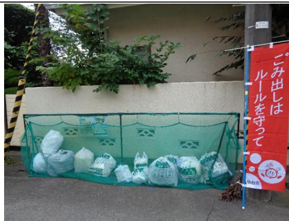
若林区豊屋丁 18 番地内

クリーン仙台推進員とクリーンメイトの方々がごみの適正な排出の為、ごみ集積所を巡回し啓発活動しています。今回、集積所診断を受け、ワケルくんの五つ星評価をいただき町内会の皆さんの協力もあり、町内会としての誇りです。コロナ渦前は、市のワケルくんバスで今泉工場などを見学したり、夏休みには子供会と保護者を対象に、ごみ集積所での勉強会を開催し分別を学び体験しました。これらは、町内会の防犯にも役立っていると思います。