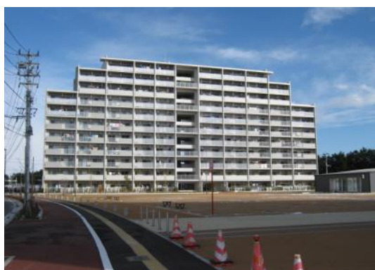
平成 28 年 1 月 復興公営住宅（荒井東地区）