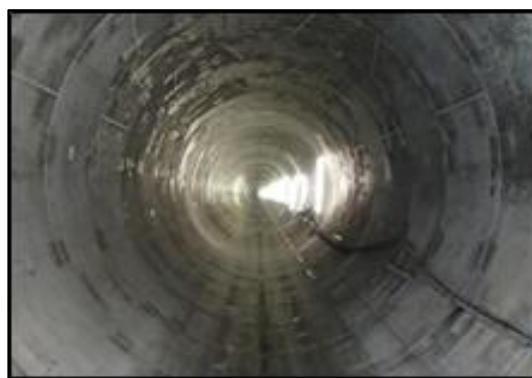
平成 29 年 3 月完成 第 2 霞目雨水幹線