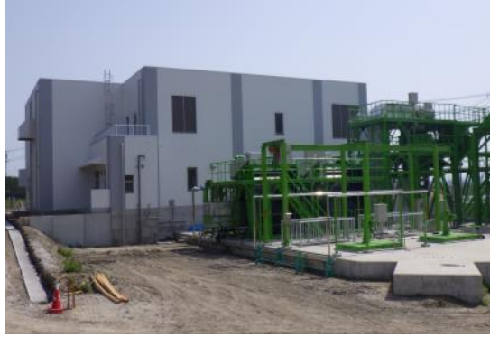
平成30年5月 荒井東雨水ポンプ場