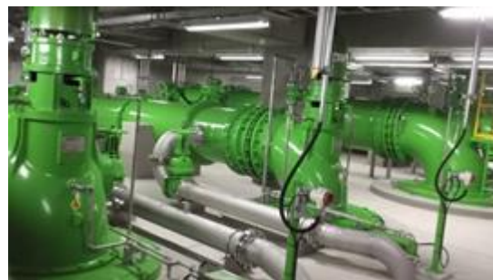
平成30年4月 荒井東雨水ポンプ場