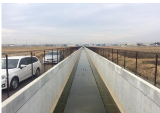
平成 28 年 9 月完成 荒井西雨水幹線