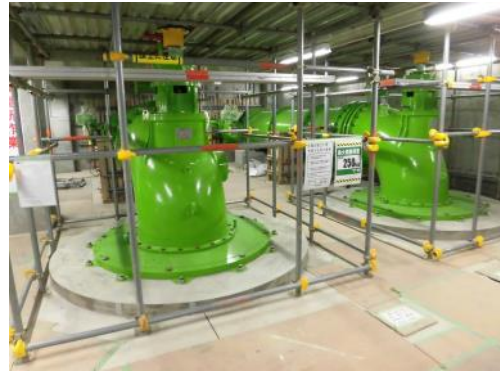
平成29年11月 荒井東雨水ポンプ場