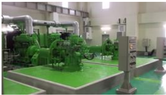
平成30年4月 荒井東雨水ポンプ場