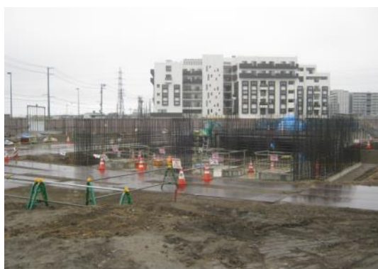
平成 28 年 6 月 荒井東雨水ポンプ場工事