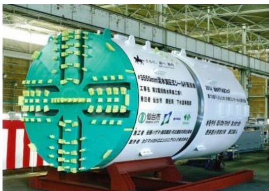
平成 26 年 12 月 シールドマシン (第 2 霞目雨水幹線工事)