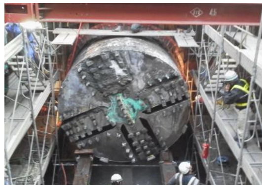
平成 28 年 2 月 シールドマシン到達 (第 2 霞目雨水幹線工事)