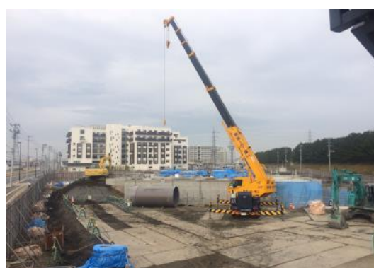
平成 28 年 12 月 荒井東雨水ポンプ場工事