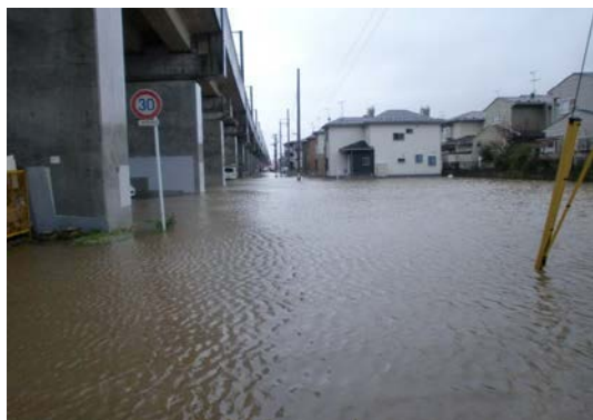
平成 22 年 12 月 22 日 西中田二丁目