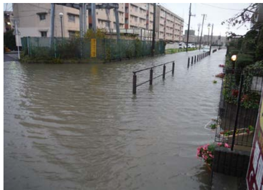
平成26年10月14日 田子二丁目