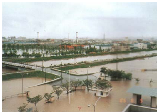
昭和61年8月5日 小鶴清掃工場より梅田川方面