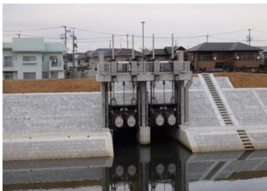
平成 28 年 10 月供用開始 仙石排水ポンプ場