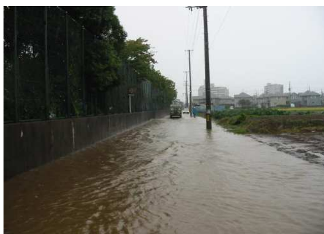
平成 18 年 9 月 28 日 四郎丸