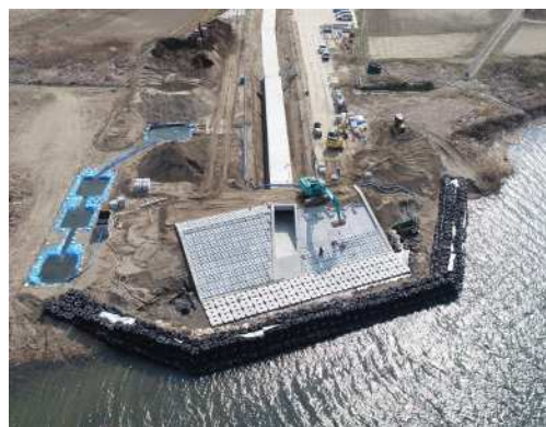
平成31年4月 放流渠工事（名取川方向より）