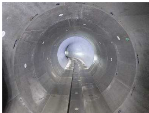
令和2年6月 地蔵前雨水幹線（坑内）