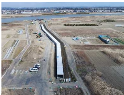
平成31年2月 放流渠工事（河川堤防方向より）