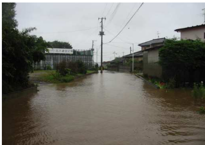
平成 18 年 9 月 28 日 四郎丸