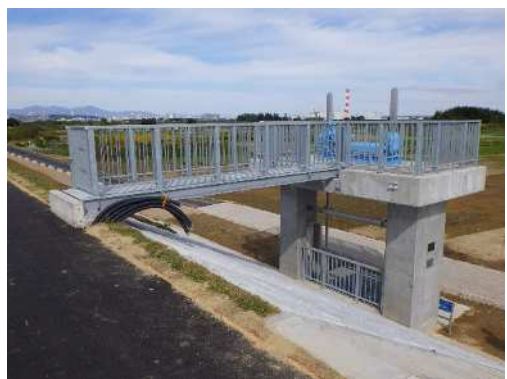
令和2年10月 排水樋門