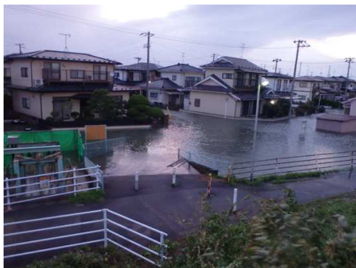
令和元年 10月 13日