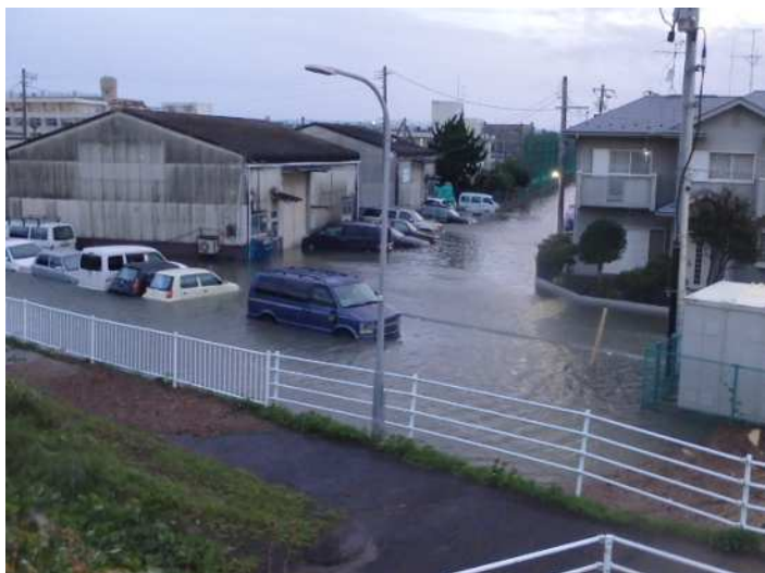
令和元年 10月 13日